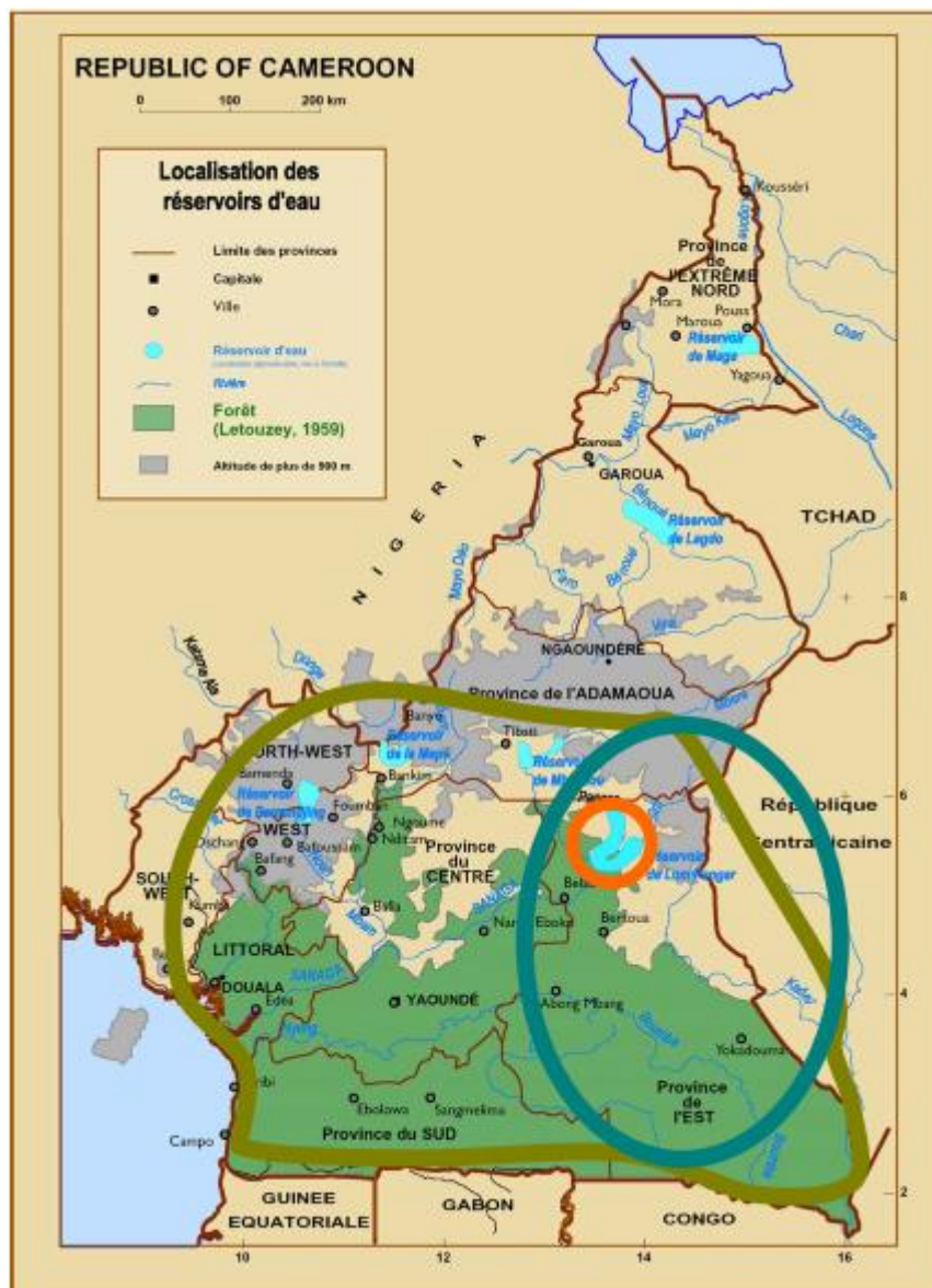
Carte 1 - Localisation géographique du projet d'aménagement hydroélectrique de Lom Pangar

L'engagement de la France à travers l'AFD tient du fait que le barrage de Lom Pangar va permettre de stimuler la production d'aluminium, développer les industries minières et améliorer la vie quotidienne des camerounais de sorte qu'il y ait moins de pannes d'électricité et de pénuries.