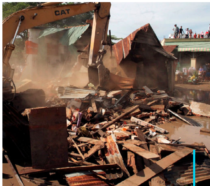
Demolición de la comunidad en el Lago Boeung Kak.

En agosto de 2011, después de que el gobierno camboyanos se mostrara renuente a resolver el conflicto, el Banco anunció que no otorgaría nuevos préstamos mientras no se encontrara una solución satisfactoria. 9 A los pocos días, el gobierno camboyanos anunció la reubicación in situ y la titulación para las casi 700 familias que aún permanecían en sus tierras.