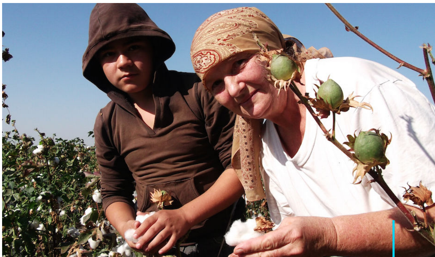
Uzbek German Forum

En la Asamblea General de la ONU celebrada en septiembre de 2017, el presidente uzbeko Shavkat Mirziyoyev reconoció públicamente por primera vez el trabajo forzado en un escenario internacional. 22