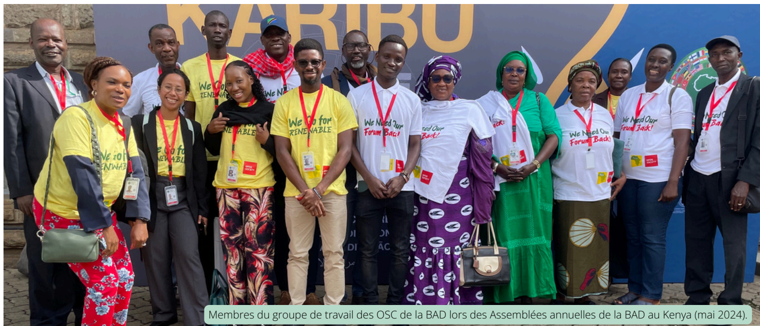
Membres du groupe de travail des OSC de la BAD lors des Assemblées annuelles de la BAD au Kenya (mai 2024).