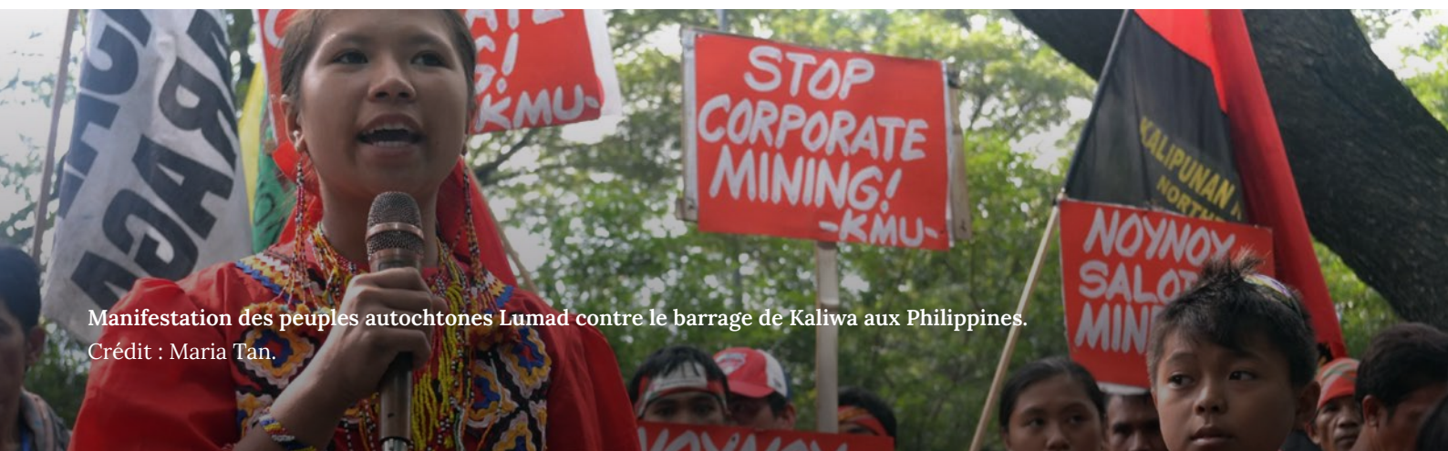
Manifestation des peuples autochtones Lumad contre le barrage de Kaliwa aux Philippines.

Si vous souhaitez être en contact avec communautés et leurs alliés qui travaillent sur dans le monde entier, écrivez à l'adresse suivante à : contact@rightsindevelopment.org