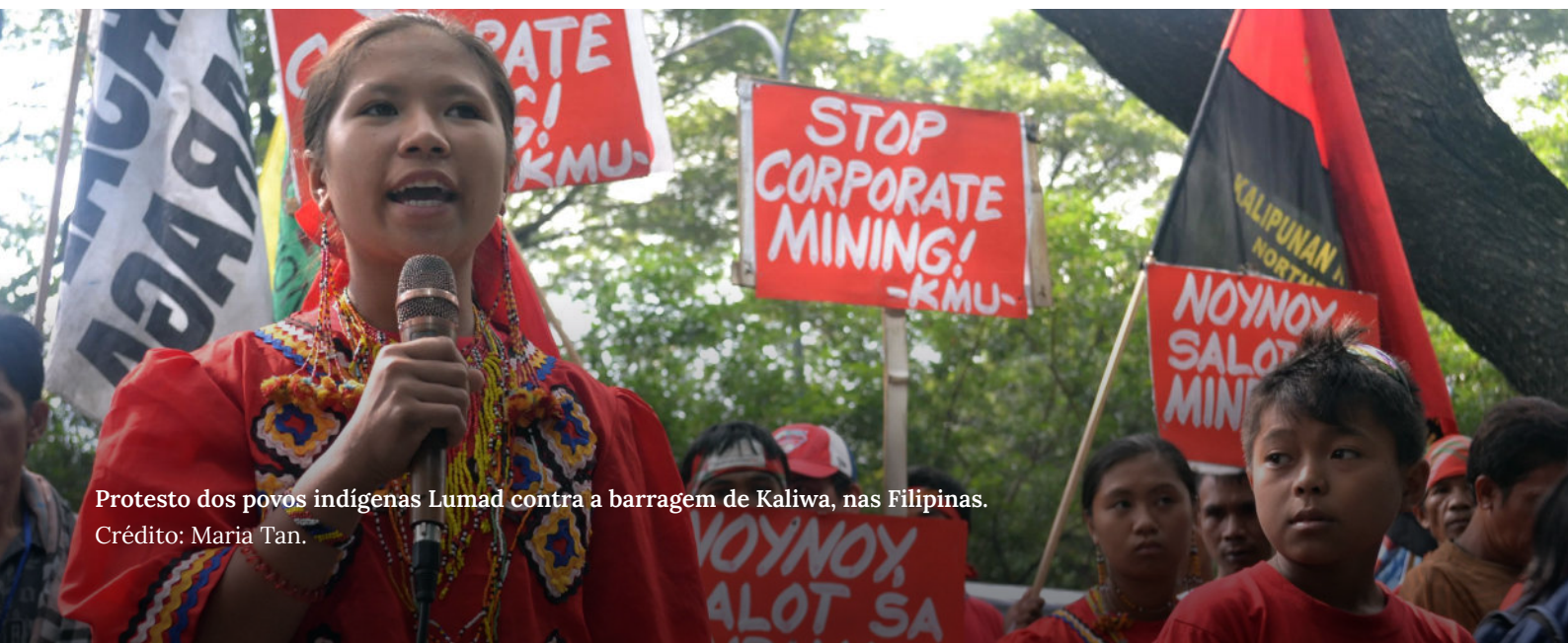
Protesto dos povos indígenas Lumad contra a barragem de Kaliwa, nas Filipinas.

Caso deseje se conectar com comunidades e seus aliados que trabalham nessas questões ao redor do mundo, escreva para contact@rightsindevelopment.org