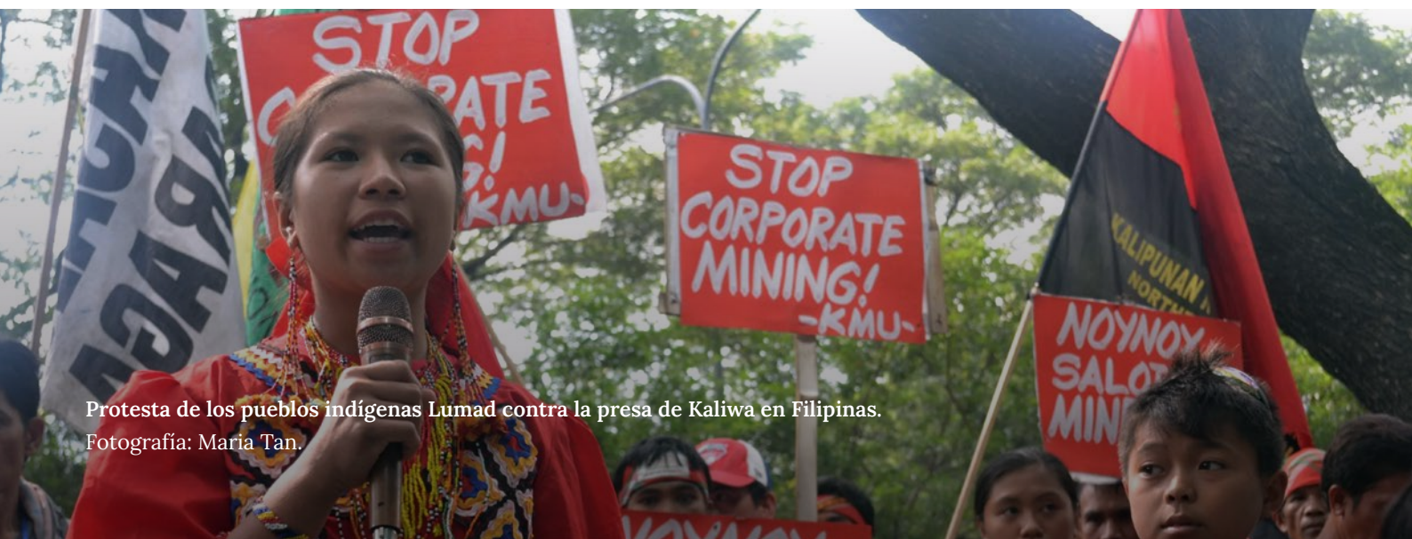
Protesta de los pueblos indígenas Lumad contra la presa de Kaliwa en Filipinas.