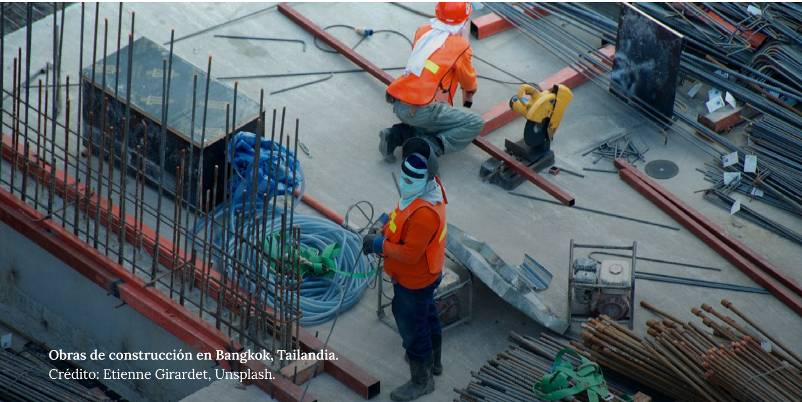
Obras de construcción en Bangkok, Tailandia.

También se analizan los factores que impulsan estas tendencias y los importantes retos que plantean.