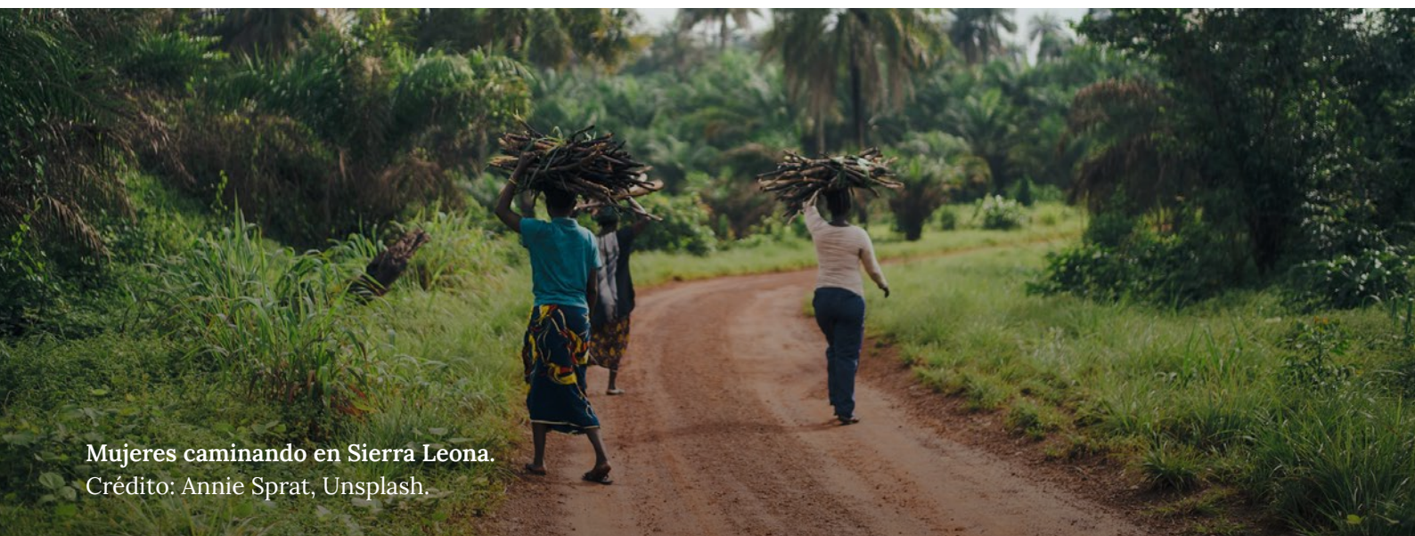
Mujeres caminando en Sierra Leona.

Los BPD se están posicionando ahora para ser la solución a la que acudir no solo para prevenir futuras pandemias y crisis, sino también para liderar la reactivación económica . 51 Con la respuesta a la pandemia y la recuperación se ha prestado más apoyo y atención a la protección social y al sector sanitario, aunque está por verse si esto se convertirá en una tendencia a largo plazo. Algunos gobiernos están trabajando con los BPD para simplemente reempaquetar viejas industrias extractivas y otras propuestas de desarrollo sucio como iniciativas de recuperación. 52