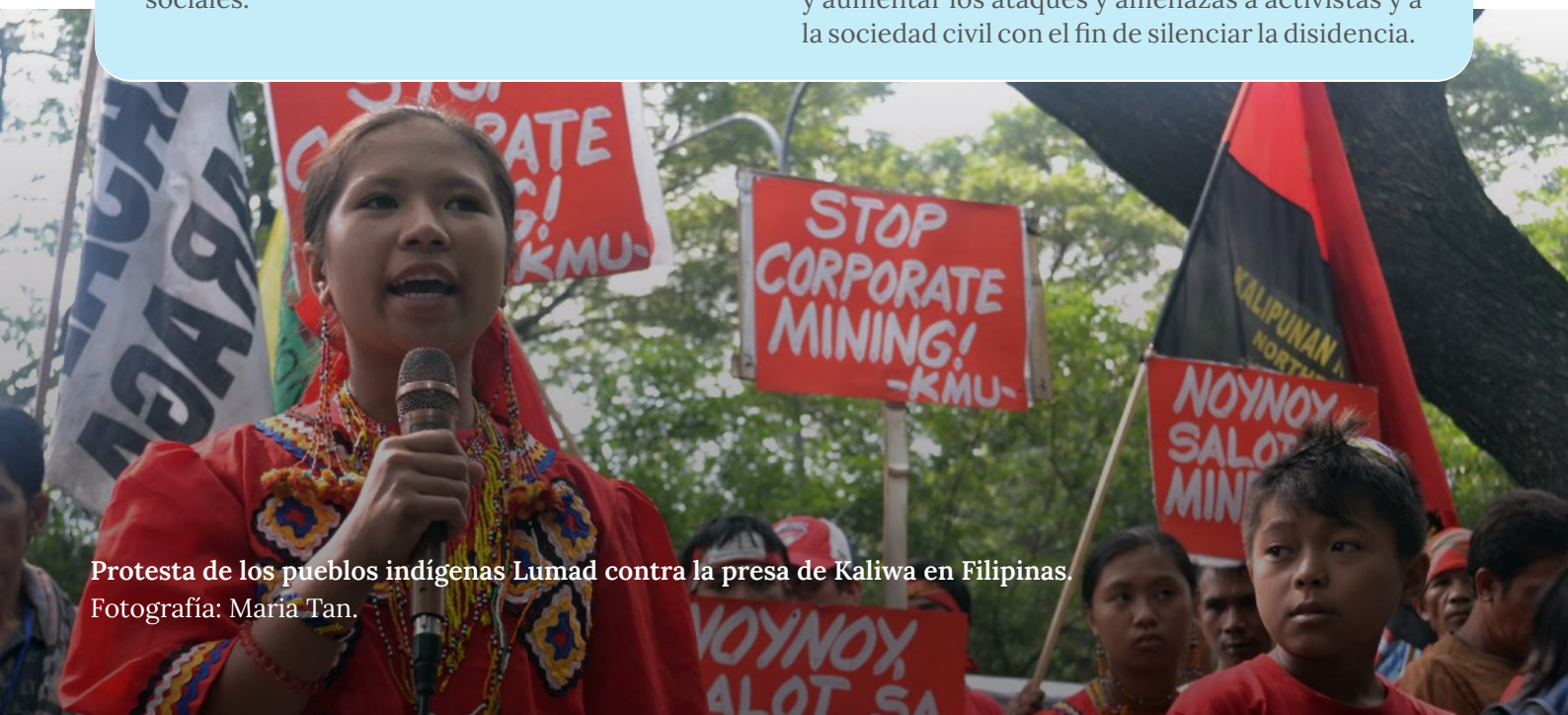
Protesta de los pueblos indígenas Lumad contra la presa de Kaliwa en Filipinas.

Las personas defensoras de los derechos humanos y las organizaciones de la sociedad civil han expresado su honda preocupación por el riesgo de vigilancia. El gobierno filipino tiene un historial de uso de la vigilancia ilegal y de violación de la privacidad de los datos. Según grupos de la sociedad civil, existe un riesgo real de que el gobierno pueda utilizar PhilSys para crear un “sistema de vigilancia integral” y aumentar los ataques y amenazas a activistas y a la sociedad civil con el fin de silenciar la disidencia.