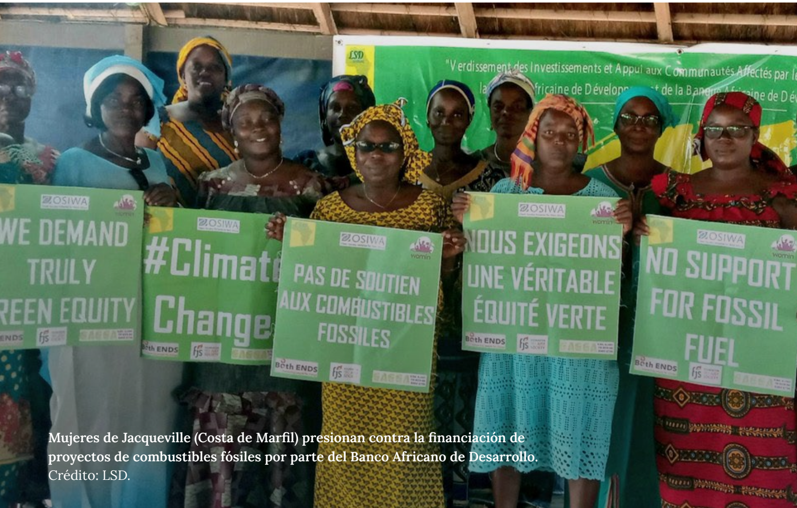
Mujeres de Jacqueville (Costa de Marfil) presionan contra la financiación de proyectos de combustibles fósiles por parte del Banco Africano de Desarrollo.

La crisis climática es “una nueva oportunidad” para que los BPD puedan gestionar más dinero. Los grandes bancos multilaterales de desarrollo son ejecutores de los fondos de la Convención Marco de las Naciones Unidas sobre el Cambio Climático (CMNUCC) –como el Fondo para el Medio Ambiente Mundial y el Fondo Verde para el Clima–, así como administradores de fondos nacionales para el clima y de sus propios Fondos de Inversión en el Clima (un fondo multilateral creado a petición del G8 y el G20, con seis bancos multilaterales de desarrollo como organismos de ejecución). 23