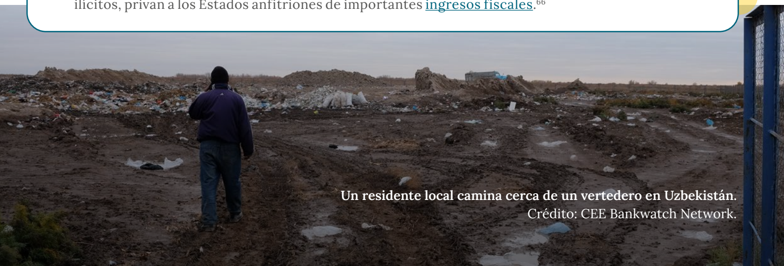
Un residente local camina cerca de un vertedero en Uzbekistán.

Los BPD que trabajan con el sector privado suelen estructurar las inversiones a través de centros financieros extraterritoriales . Cuando los BPD no abordan la evasión fiscal o los flujos financieros ilícitos, privan a los Estados anfitriones de importantes ingresos fiscales . 66