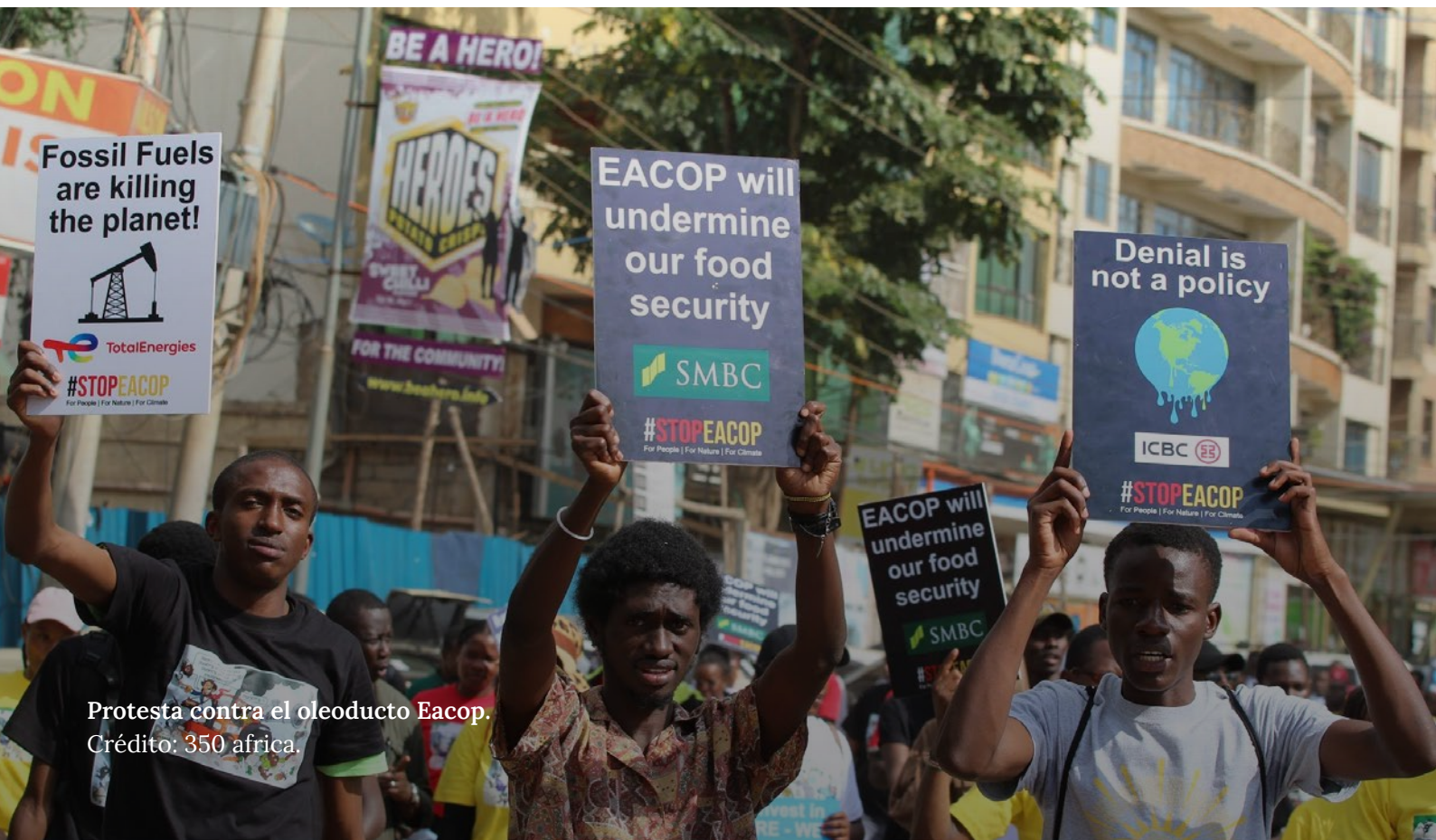
Protesta contra el oleoducto Eacop.

Los países ricos han incumplido sistemáticamente sus compromisos de aportar fondos para la adaptación al cambio climático y su mitigación, y de hecho la mayor parte de lo que han concedido como “ financiación climática ” es financiación para el desarrollo reempaquetada que se transfirió de otros sectores. 21 Al mismo tiempo, los BPD siguen posicionándose para desempeñar un papel más importante en la respuesta mundial al cambio climático. 22