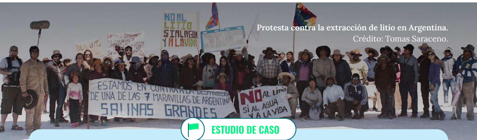
Protesta contra la extracción de litio en Argentina.

En lugar de entablar conversaciones sobre el derecho al desarrollo, el desarrollo dirigido por la comunidad y la necesidad de optar por el decrecimiento en el Norte Global, los BPD se centran en aumentar la producción de minerales para apoyar la falacia del crecimiento económico eterno más allá de los límites planetarios. Promueven modelos de desarrollo extractivistas y orientados a la exportación, con el Sur Global y los territorios indígenas reducidos a zonas de sacrificio al servicio del sobreconsumo en el Norte Global. 38