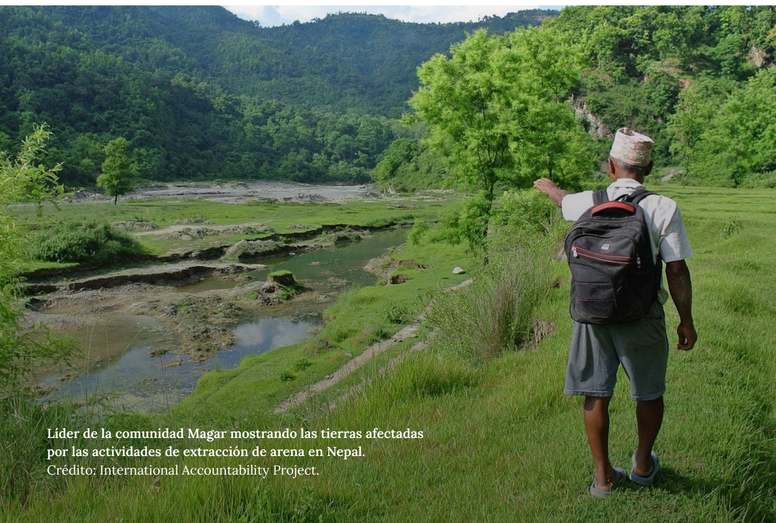
Líder de la comunidad Magar mostrando las tierras afectadas por las actividades de extracción de arena en Nepal.

Para impulsar este enfoque, el Banco Mundial y otros grandes bancos de desarrollo han promovido reformas políticas centradas en la creación de entornos propicios para que los agentes privados hagan negocios. Por ejemplo, publican estudios que identifican las prioridades de reforma (como el Diagnóstico del Sector Privado del Banco Mundial), o incluyen en sus préstamos condiciones previas obligatorias que crean un entorno propicio para los negocios (como se describe en la sección sobre préstamos políticos). 61